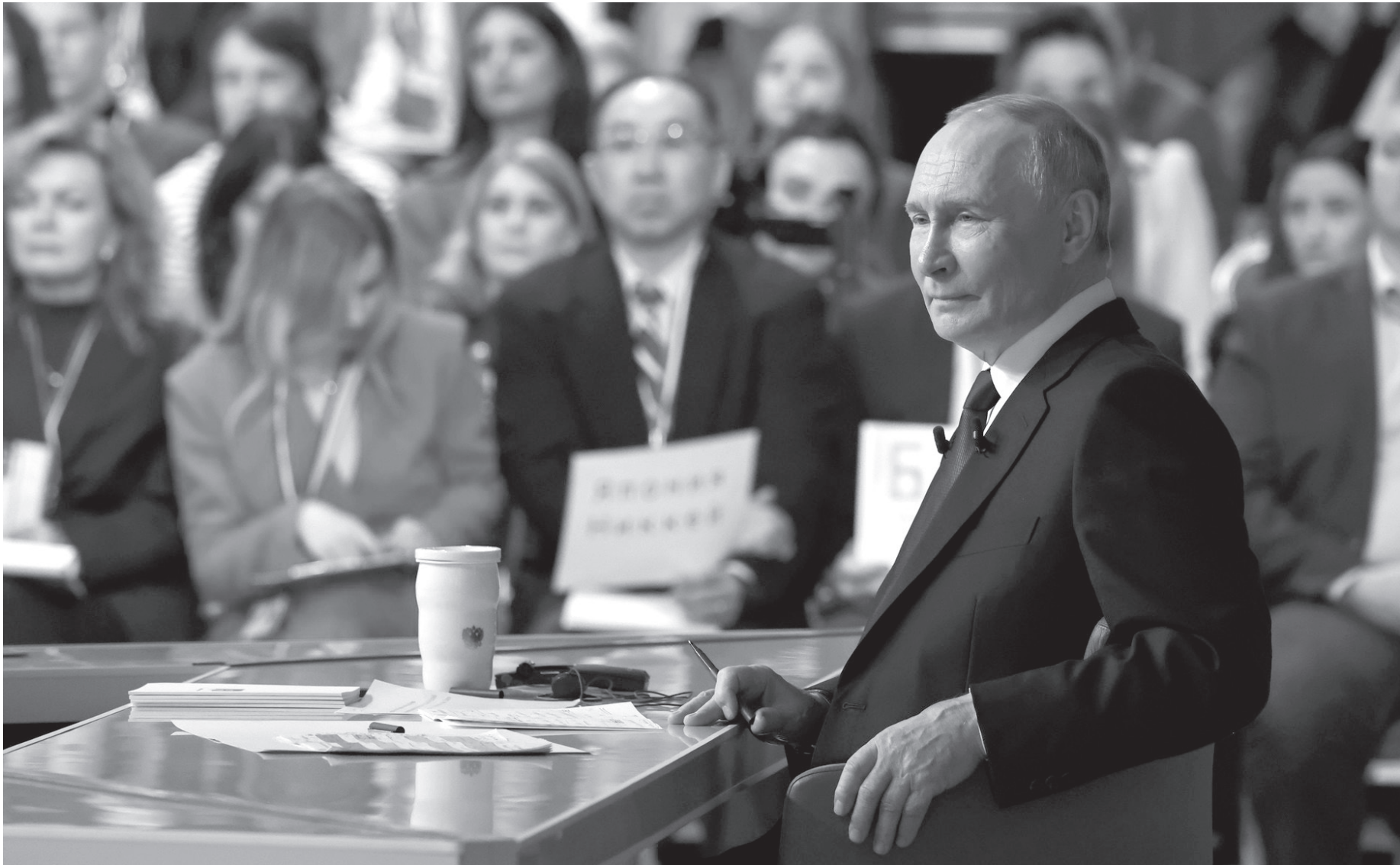
Прямая линия охватила почти все ключевые темы, волнующие страну и мир

Президент отдельно подчеркнул: после освобождения Курской области стратегическая инициатива перешла к россий-